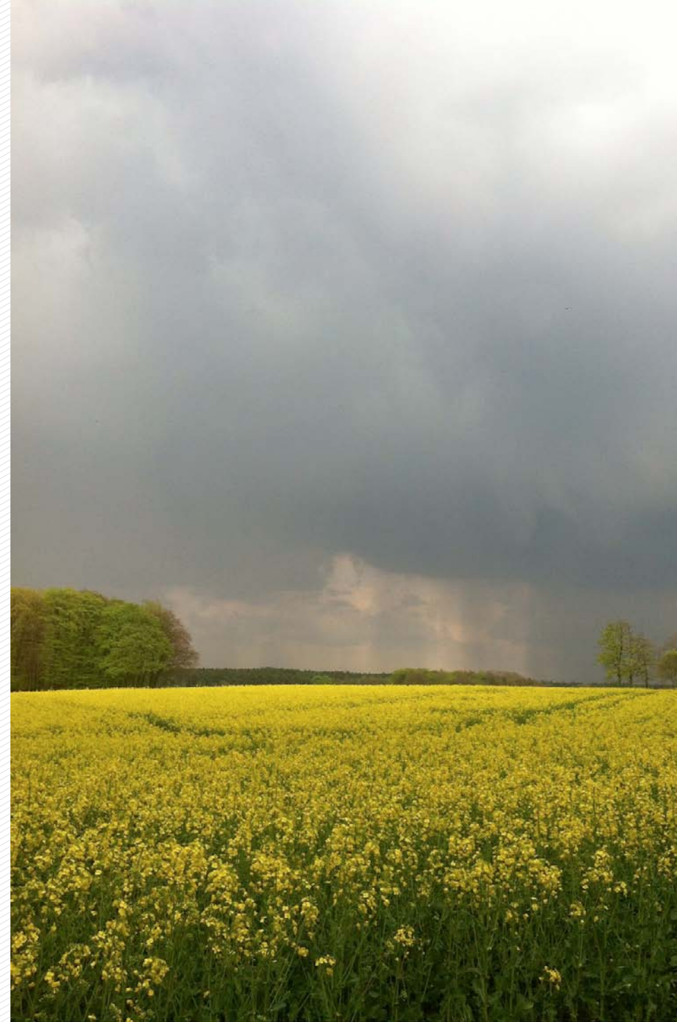
Kurz vor einem Gewitter in der Lüneburger Heide