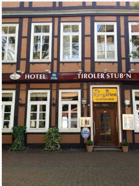
Heimatgefühle in Celle